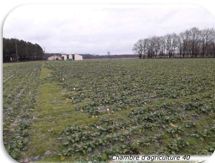
Chambre d'agriculture 40

L'essai était constitué par trois répétitions conduites en grandes parcelles. Chaque parcelle a été implantée grâce à un semoir pneumatique 8 rangs avec un écartement de 40 cm, les dimensions étaient donc de 3,20 mètres de large sur 80 mètres de long soit 2,56 ares par parcelle élémentaire. Pour la campagne 2020-2021, nous avons testé cinq variétés différentes dont une référence locale. Les variétés pouvaient être soit des hybrides (ES Capello, Miranda et Astana), soit des lignées (Randy et ES Mambo). Nous avons aussi testé une modalité avec une plante compagne semée sur le rang (trèfle d'Alexandrie gélib Tabor), une modalité fertilisée au printemps avec de l'Azopril et trois modalités à trois densités différents. La variété Randy semée à densité moyenne correspond au témoin.