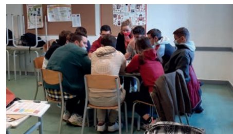
Elèves de 1 ère du Lycée St-Yrieix-la-Perche

Dans le cadre du festival, des interventions d'Afdi en milieu scolaire ont également eu lieu en Charente, Charente-Maritime, Gironde et Vienne.