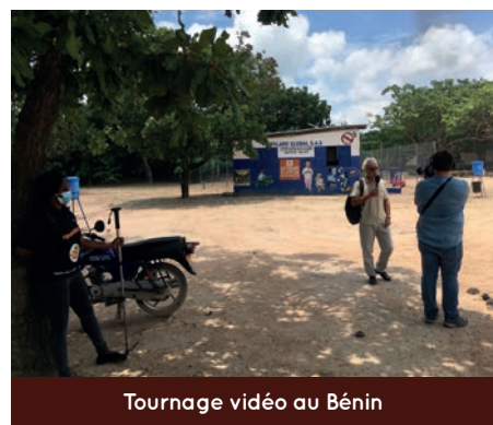
Tournage vidéo au Bénin

Des hypothèses ont été confrontées aux réalités de la filière anacarde au Bénin, et une priorisation des services à améliorer. Une rencontre conjointe avec Tolaro et l'URCPA a permis de faire le bilan de la dernière campagne de commercialisation, en baisse par rapport à la précédente.