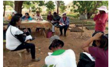
Échanges entre membres de Fisoi et MEx