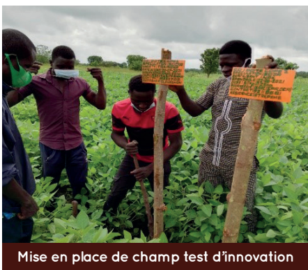
Mise en place de champ test d'innovation

Ainsi depuis quatre ans, l'UAR a mis en place des champs test d'innovation testant différentes associations de cultures céréales